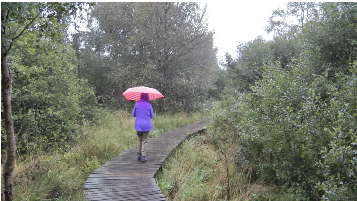
Die Regenwanderung im Hohen Venn