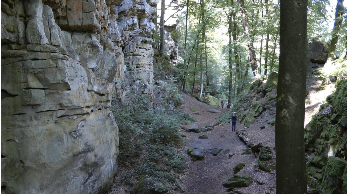
Wanderung unter imposanten Felswänden

Ich habe gut gewählt: Die Teufelsschlucht ist eine grossartige Naturarena mit imposanten Felsen. Da müssen sogar wir Bergler staunen. Der Weg durch die Schlucht ist ziemlich anspruchsvoll mit steilen Auf- und Abstiegen und engen Durchschlupfen zwischen den Felstürmen. Sehr abwechslungsreich!