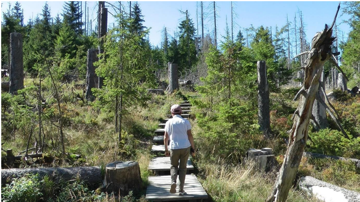
Wanderung im Harz

Rundwanderung. Ganze Waldstücke sind total dürr (Borkenkäfer sagt man uns!). Nur wenig Leute unterwegs. Der Weg ist staubtrocken. Kaum Pflanzen und Blumen.