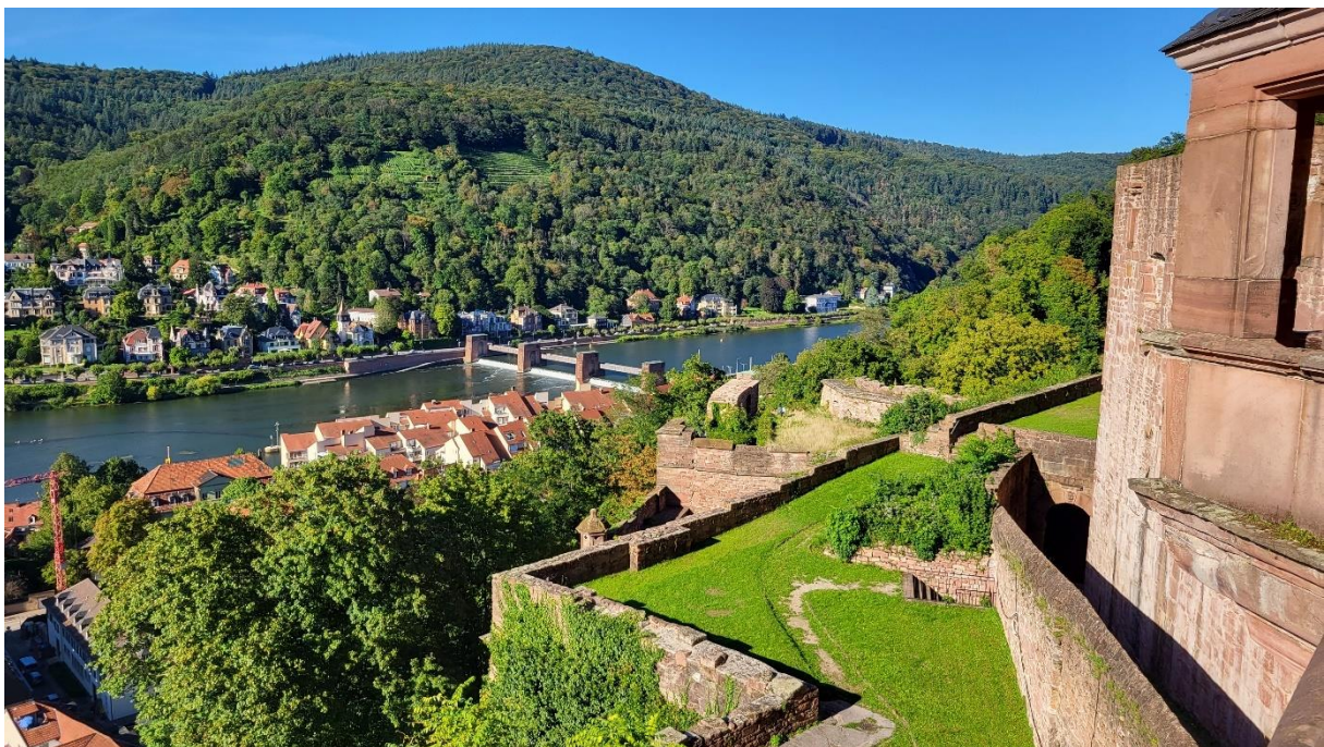
Blick von der Schlossterrasse auf Neckar und Odenwald

Prima Nachtessen in einem italienischen Restaurant beim Kurparkmuseum. Dann geht's ‚heim‘ in unsere gemütliche Unterkunft. Wir dürfen konstatieren: Heidelberg ist allemal einen Besuch wert.