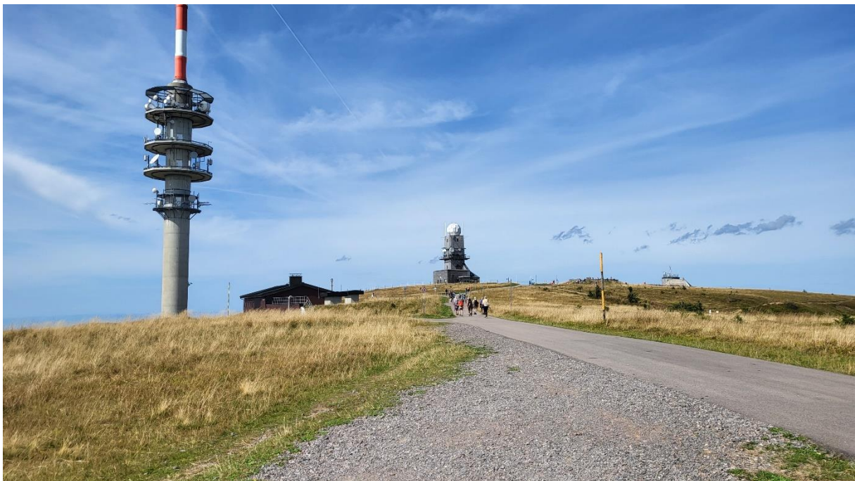
Oben auf dem Feldberg

Wir wollen auf den Feldberg, dem höchsten Berg im Schwarzwald. Gondel mit zwei blöden Girls. Knipsen im Sekundentakt Fotos.