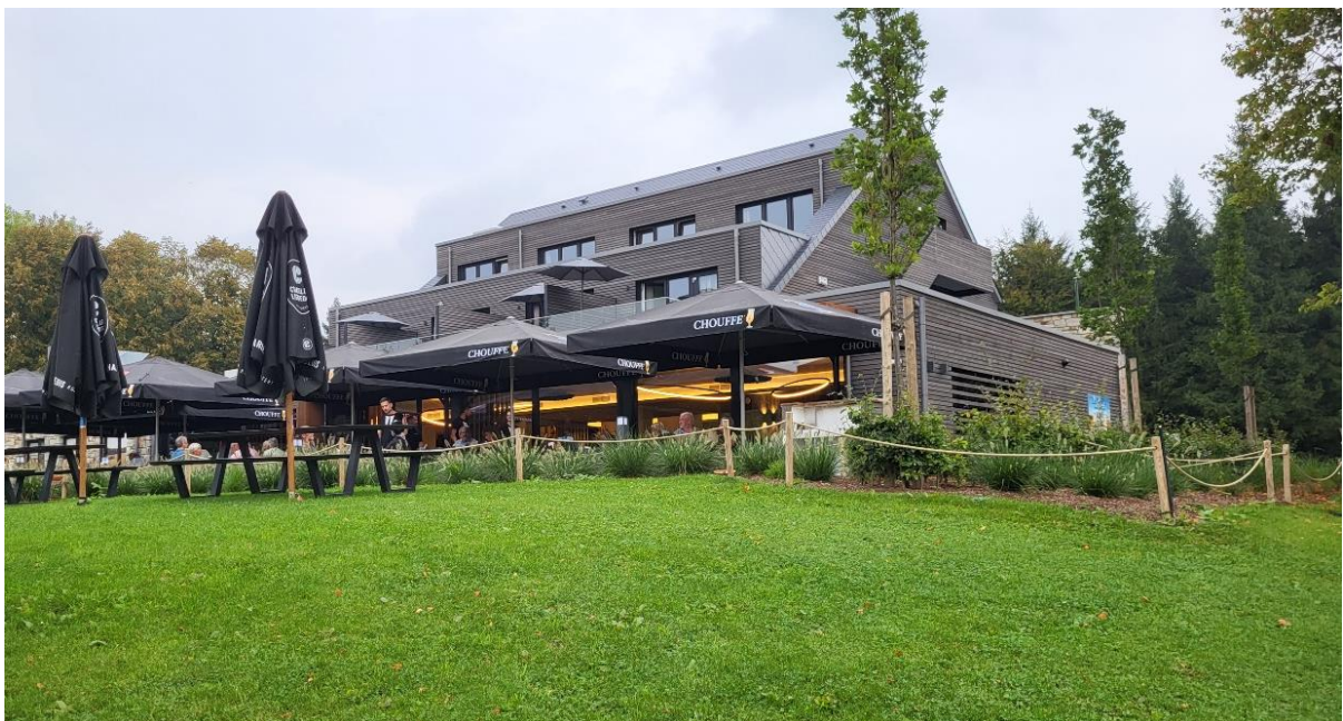
Hotel LeMont Rigi