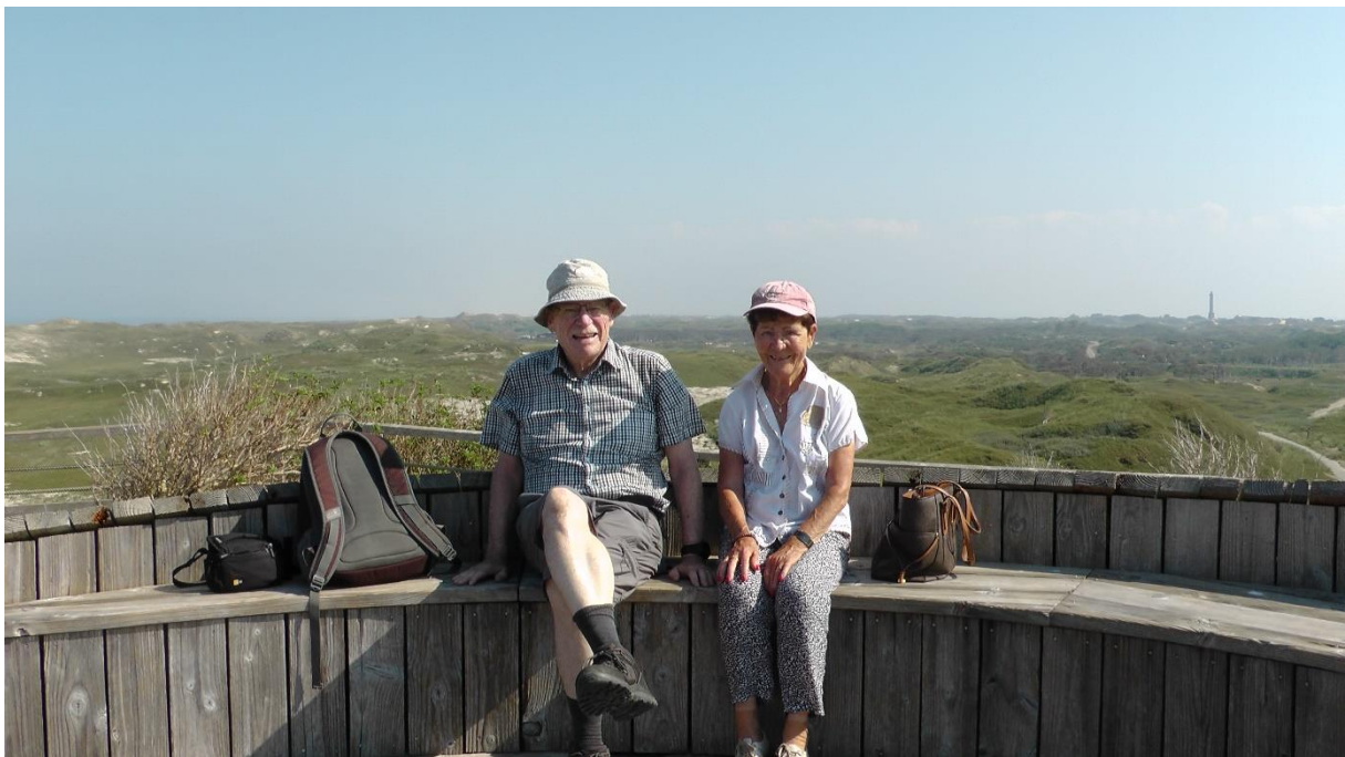
In den Dünen von Norderney

Wir laufen auf dem Weg zwischen Dünen bis zur weissen Düne.