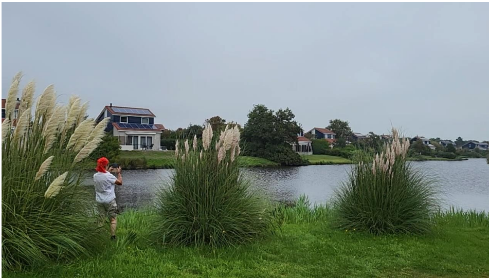
Beim Hotel Greenside

Und das Beste: Wir bleiben hier 2 Tage. Morgen muss ich mich also nicht ins Verkehrsgewühl stürzen.