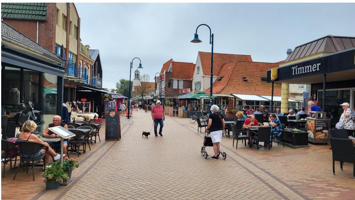
Dorfstrasse von DeKoog (Texel)

In de Koog ist unser Hotel Greenside, das wir erst nicht finden! Nettes Personal und grosser Parkplatz.