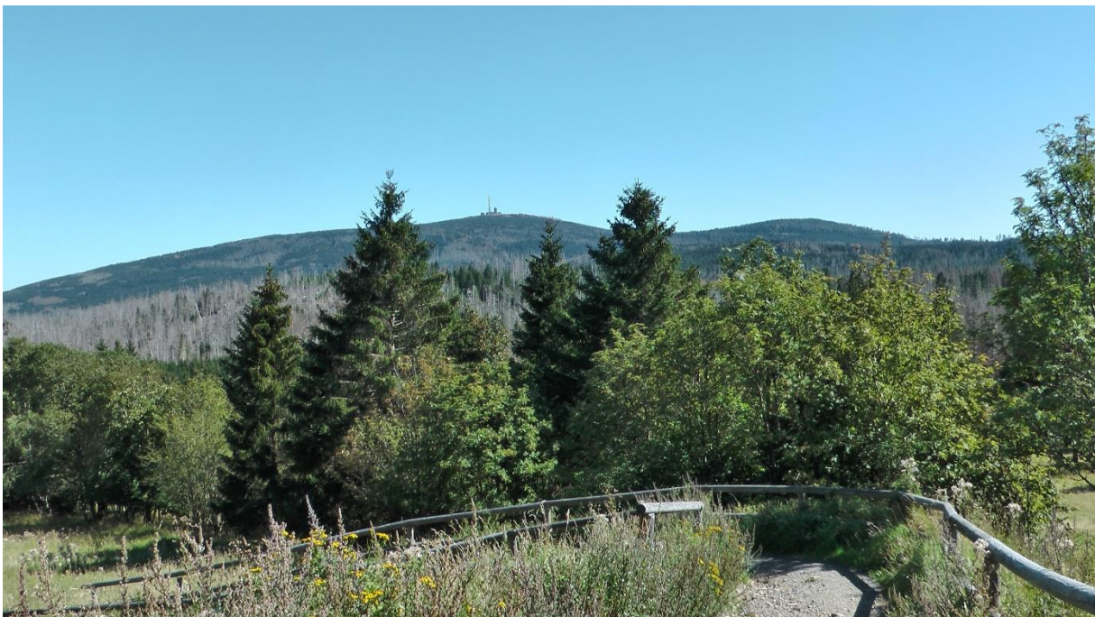
Torfhausrunde mit Brocken im Hintergrund

Es ist ein schönes Wandergebiet, das hatten wir schon vor 10 Jahren festgestellt, als wir auf der Rückreise von Skandinavien hier durchkamen. Man hat die Qual der Wahl angesichts der vielen Wanderrouten.