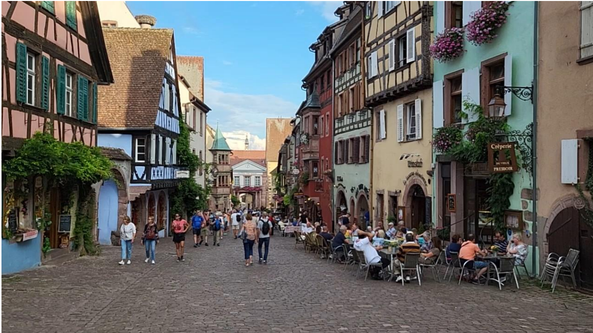
Volle Beizen in Riquewihr

Abends Bummel durch die alten Gassen des Weindorfes. Es gibt viele schöne Restaurants, die zum Abendessen einladen. Aber auch viele Wochenendgäste (es ist Freitagabend), so dass die Plätze (vor allem die im Freien) ziemlich belegt sind.