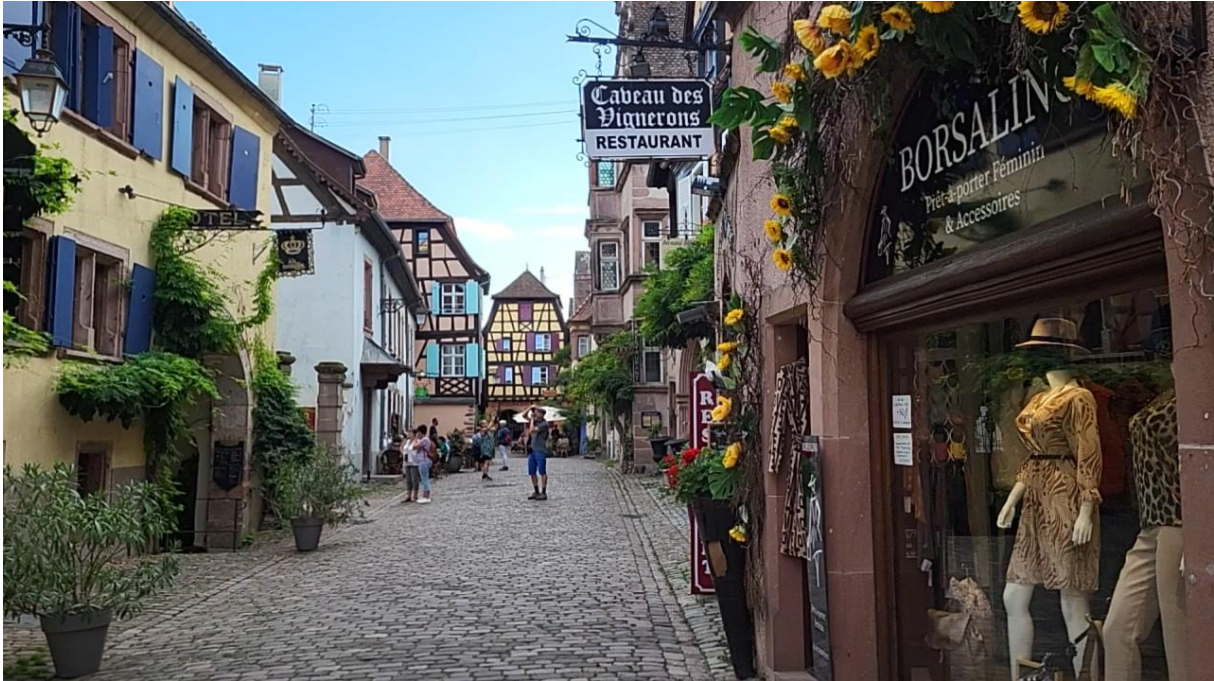
Riquewihrs malerische Dorfstrasse