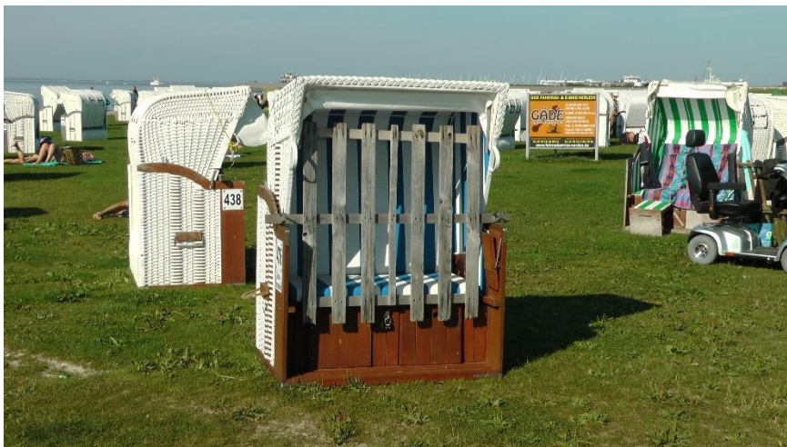
Wer hats erfunden?

Aber leider herrschte gerade Flutzeit, und vom Watt war nicht viel zu erblicken. Dafür viele Feriengäste, die sich am Strand tummelten (es ist ja Wochenende!). Und überall die unvermeidbaren Strandkörbe, eine typisch deutsche Erfindung.