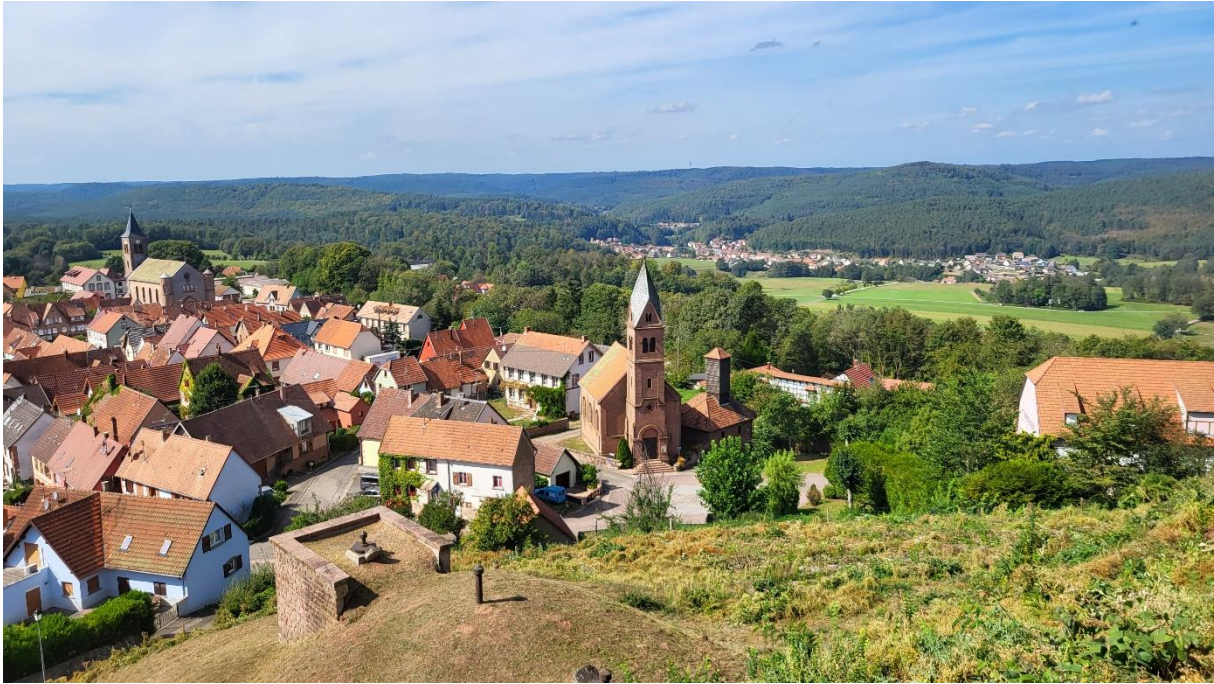
Lichtenberg in den nördlichen Vogesen

Ein kleiner Lichtblick auf der Fahrt ist die Ortschaft Lichtenberg, hoch oben in den Vogesen gelegen, die von einer mächtigen Burg auf einem Hügel beherrscht wird. Das wäre doch eine echte Attraktion für Touristen!