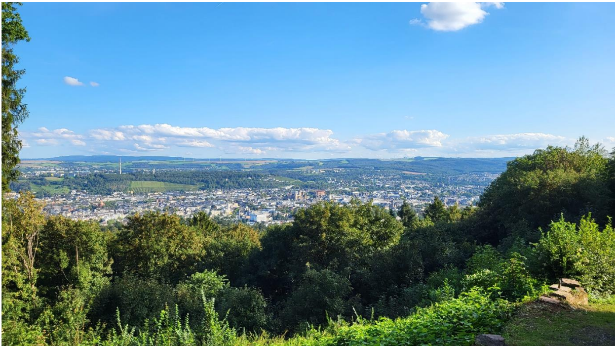
Blick hinunter auf Trier

Von der grossen Schlossterrasse aus hat man dazu einen wunderbaren Blick hinunter auf die Stadt und das Tal der Mosel.