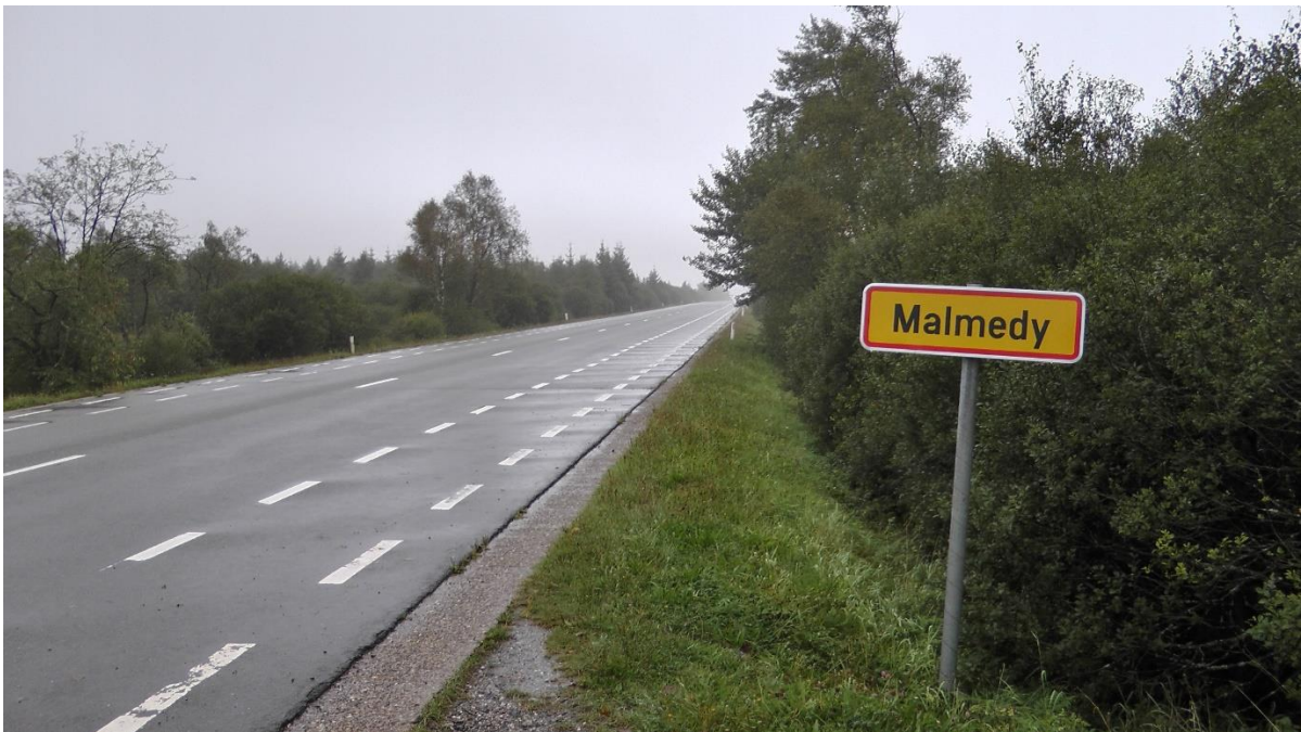
Hinauf in die Ardennen

Als wir dann endlich die belgische Grenze hinter uns hatten, die Autobahn verliessen, und in die Ardennen hochfuhren, war uns fast, als kämen wir in den Himmel! Eine schöne hügelige Wald- und Wiesenlandschaft.