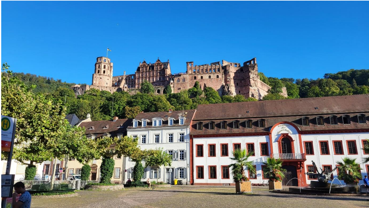
Blick von der Altstadt auf das Schloss