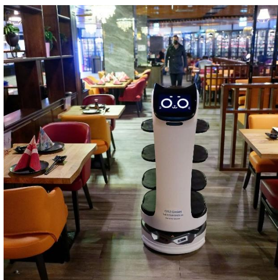
Perfekte Bedienung !

Auch das (menschliche) Personal ist hier wirklich sehr nett.