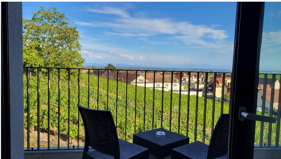
Blick aus unserem Hotelzimmer

Darum kennen wir auch unser Hotel schon, und es hat sich seitdem nicht gross verändert (Best Western Schönenbourg). Wir beziehen ein schönes helles Zimmer mit Balkon und Ausblick direkt in die umliegenden Rebberge. Eine echte Erholung nach dem Autobahnstress!