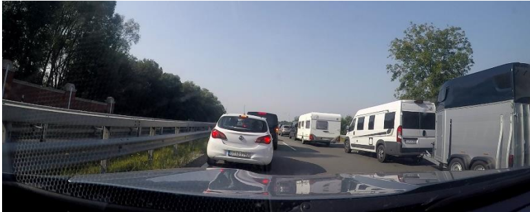
Im Stau !!!

Kaum aus Norddeich losgefahren, steckten wir auch schon im Schsch....tau ! Und zwar noch auf deutschem Gebiet, auf der Stadumfahrung von Leer (was für ein doofer Name für einen Ort!). Eine endlose Autokolonne, darunter auch viele Brummis. Es ging nur noch im Schritttempo vorwärts (was heisst hier Schritttempo? Das waren höchstens noch 2 km/h). Und die nächste Autobahnausfahrt war etwa 4 km entfernt! Das gibt nach Adam Riese einen Zeitverlust von etwa 2 Stunden. Der Grund war dabei total unklar. Es war kein Verkehrsunfall auf der Strecke, auch keine Baustelle. Das einzige was wir auf Google Maps sahen war, dass die Autobahn weiter vorne durch einen Tunnel unter der Ems hindurchführt, wo sich die Strasse offenbar verengt?