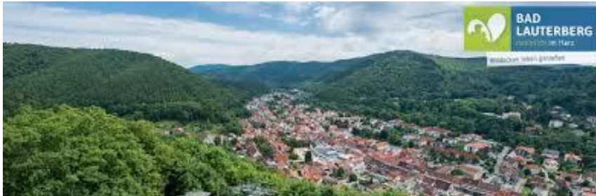
Bad Lauterberg im Harz