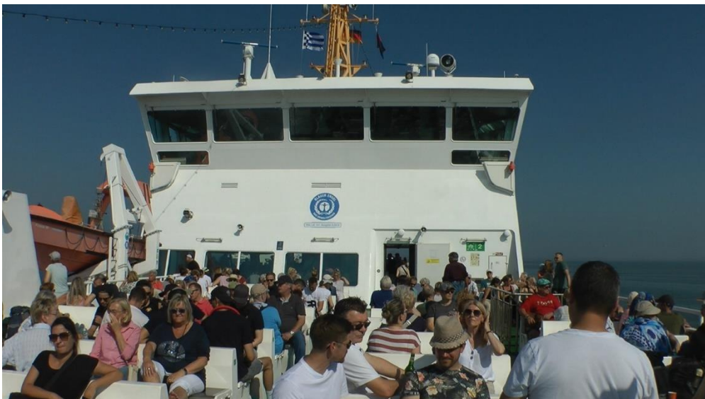
Fähre voll besetzt

Die Überfahrt mit der Fähre von Norddeich aus dauert ca. 45 Minuten. Auch hier sehr viele Ausflügler, auf Deck gibt's fast keine freien Plätze.