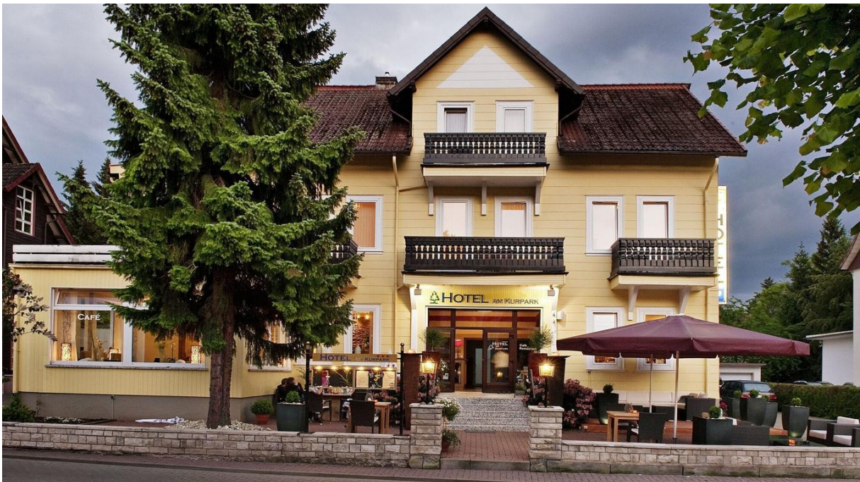
Hotel 'Am Kurpark'

Hotel am Kurpark ist recht gut, inkl. zweitem Zimmer! 100 Euro pro Person und Nacht.