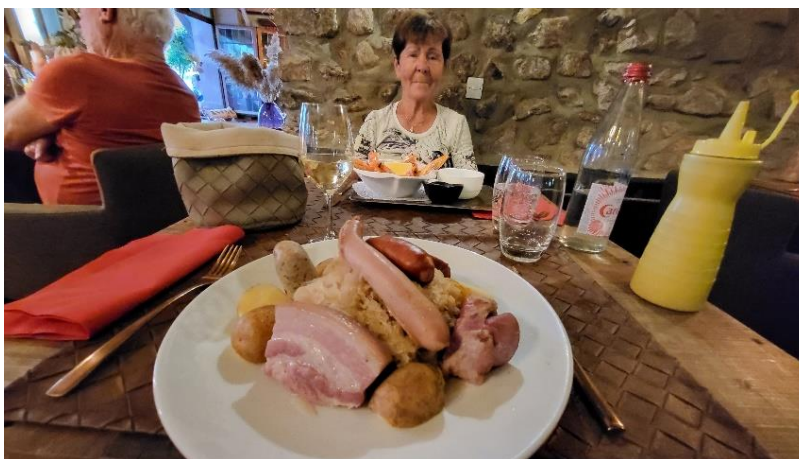
Unser Diner !

Einzig der Gewürztraminer (Weinspezialität des Elsass) schmeckt prima, und wir beschliessen, morgen gleich 2 Flaschen davon zu kaufen.