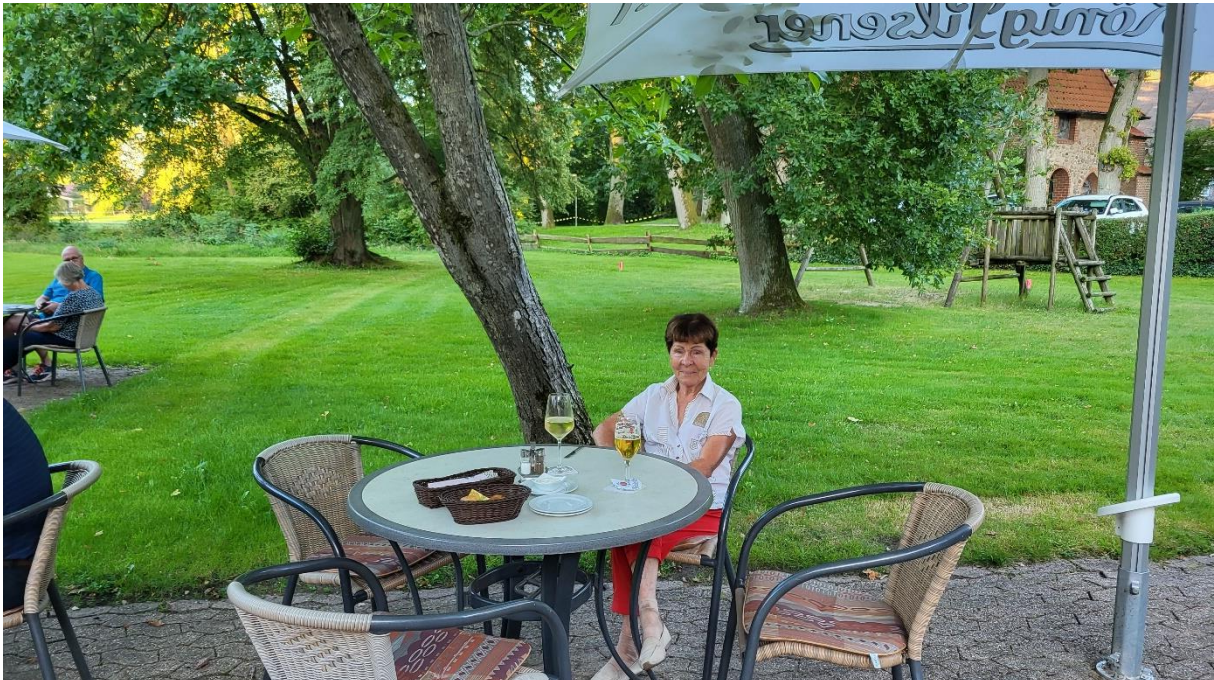
Abendessen im Hotel Riekmann