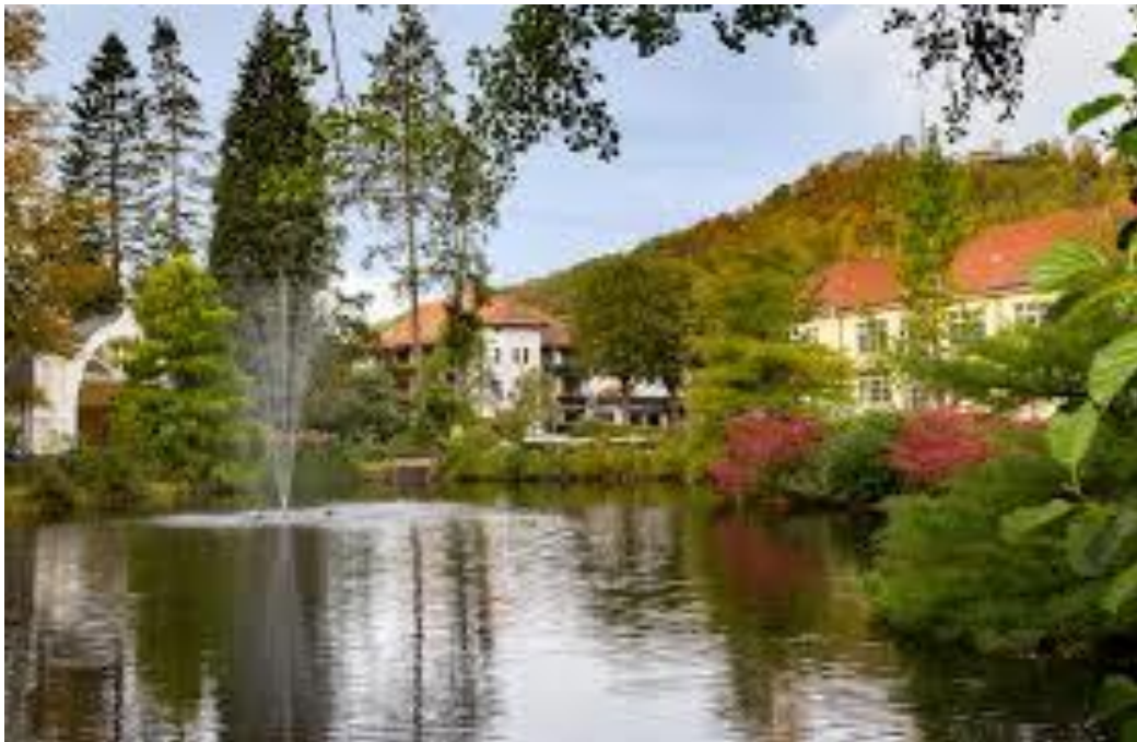
Bad Lauterberg Kurpark

Zurück in Bad Lauterberg machen wir noch einen gemütlichen Spaziergang durch den Kurpark, der sehr schön angelegt ist (Sportanlagen, Minigolf, Kneipp-Wassertreten etc). Abendessen diesmal in einem griechischen Restaurant (sehr gut!).