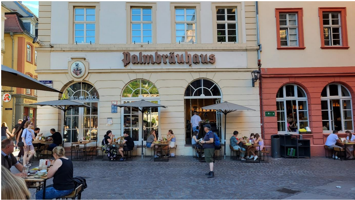
In der Altstadt

Prima Nachtessen in einem italienischen Restaurant beim Kurparkmuseum. Dann geht's ‚heim‘ in unsere gemütliche Unterkunft. Wir dürfen konstatieren: Heidelberg ist allemal einen Besuch wert.