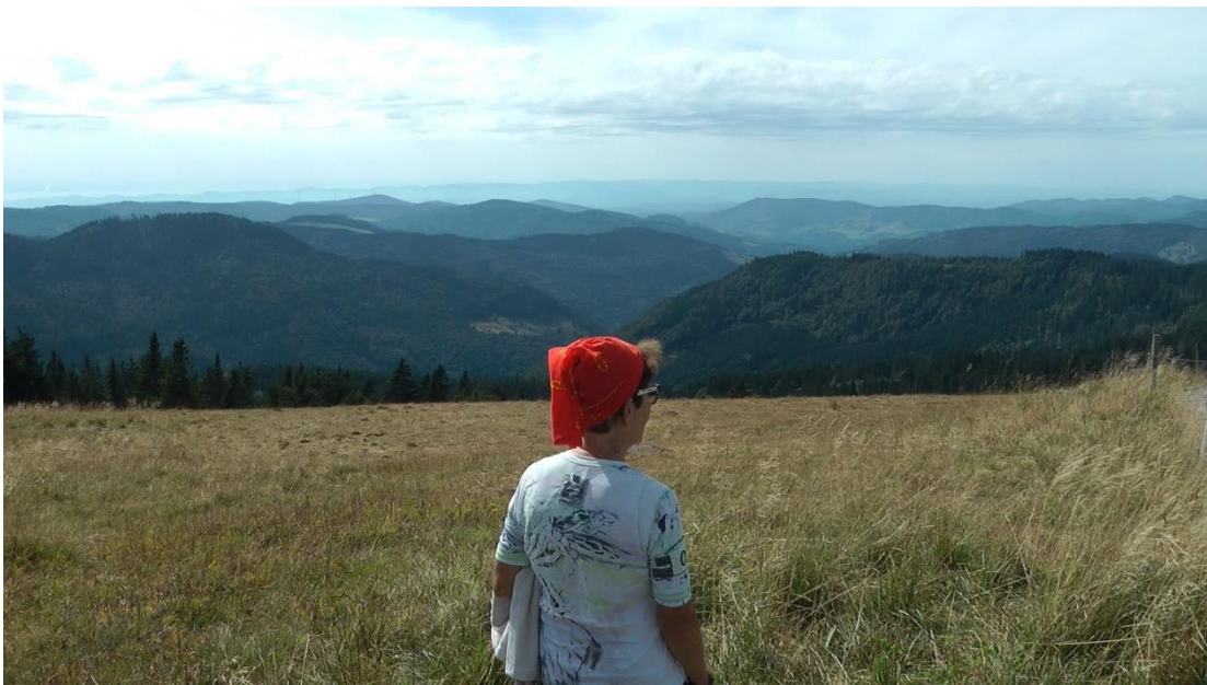
Ausblick vom Feldberg Richtung Schweiz

Vom Seebuck aus erreicht man nach einem leichten Aufstieg den Feldberg-Gipfel (ca. 1500m). Schöner Rundblick über den Schwarzwald.