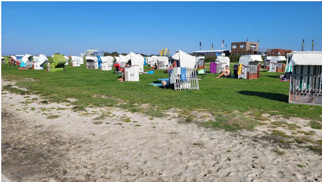
Am Strand von Norddeich

Wir spazieren ¼ Stunde zum Strand. Ist gerade zwischen Ebbe und Flut. Alle Restaurants sind an der Hauptstrasse. An der Beach viele Leute. Irgendwo trinken wir noch Bier / Cocktail.