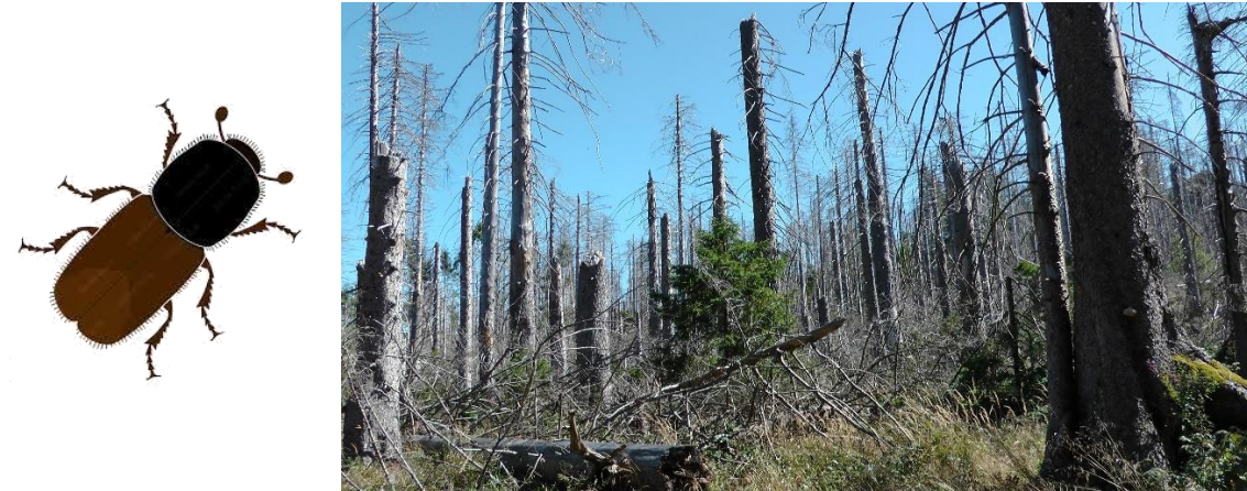
Oh jeh ! Da hat der Borki gewütet!

Zurück in Bad Lauterberg machen wir noch einen gemütlichen Spaziergang durch den Kurpark, der sehr schön angelegt ist (Sportanlagen, Minigolf, Kneipp-Wassertreten etc). Abendessen diesmal in einem griechischen Restaurant (sehr gut!).